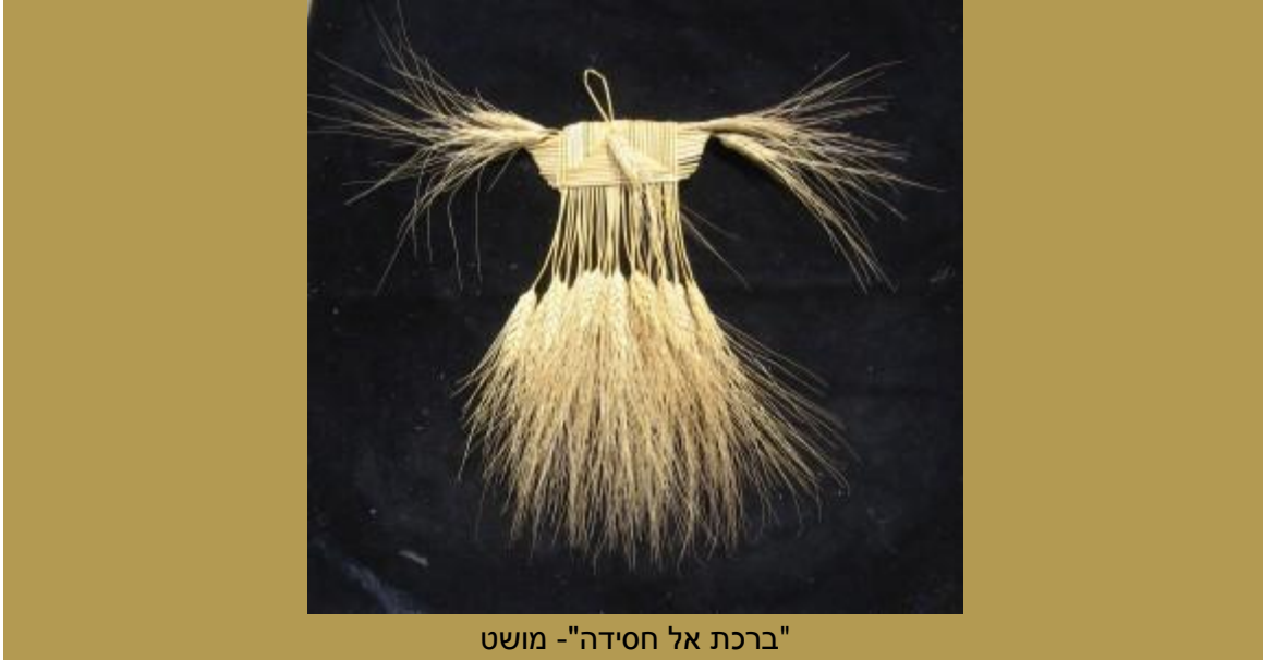
"ברכת אל חסידה" - מושט